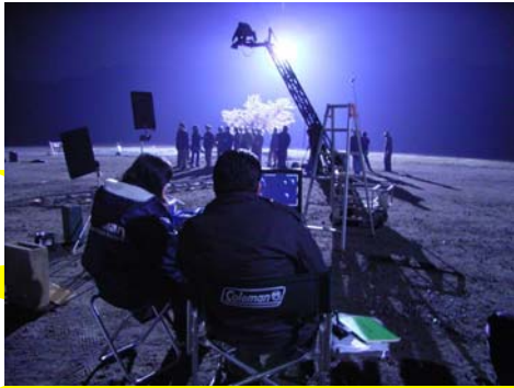
この大きな背中とは...