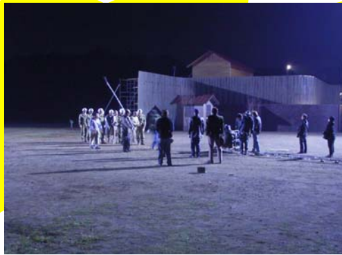
緑山スタジオのオープンセットです